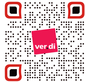
Wahlprogramm der Ver.di—Listen